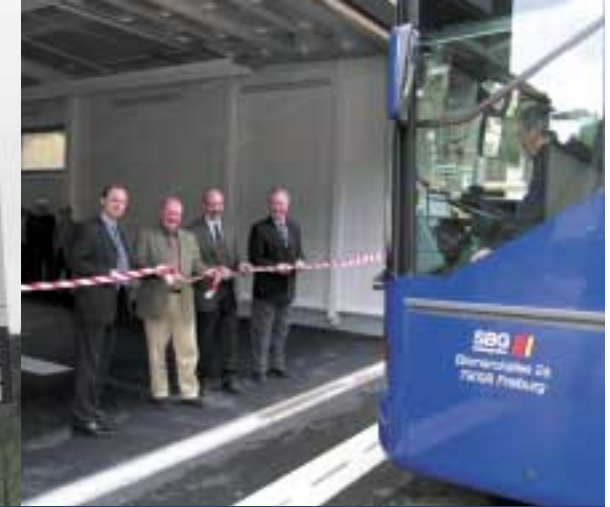
St. Blasien: Der erste Bus darf in die neue Halle

Neue Betriebshöfe für Furtwangen und Freiburg, Fertigstellung St. Blasien: