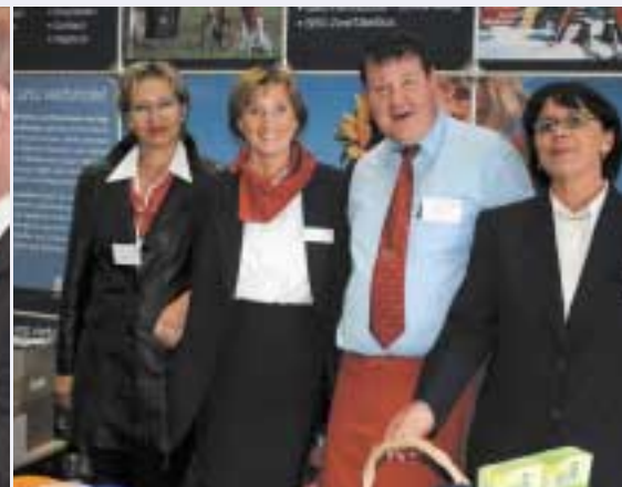
Bereit für die Gäste: Das Festteam der Niederlassung Radolfzell