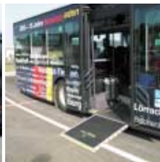
Unsere neue Setra-Flotte