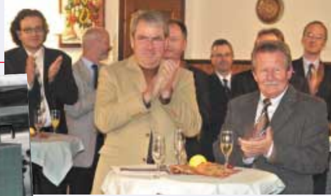
Jubiläumsfeier mit unseren Partnern in Bonndorf am 15.10.2004