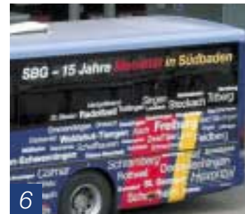
15 Jahre SBG – es gab viel zu feiern!