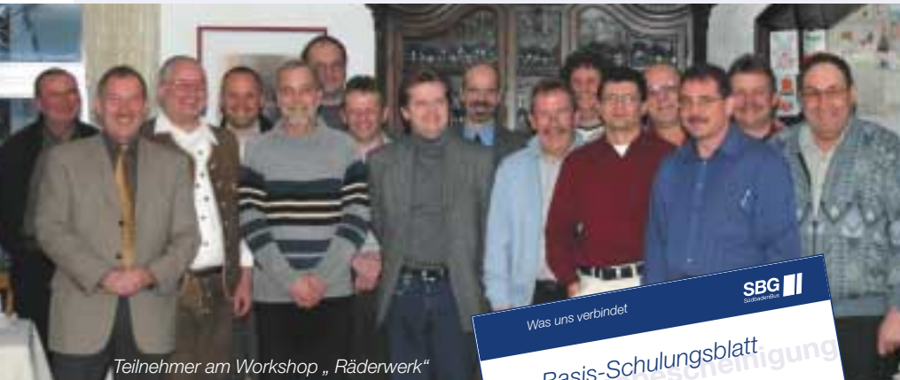
Teilnehmer am Workshop „Räderwerk“

Die Schulungen der Fahrer werden dokumentiert