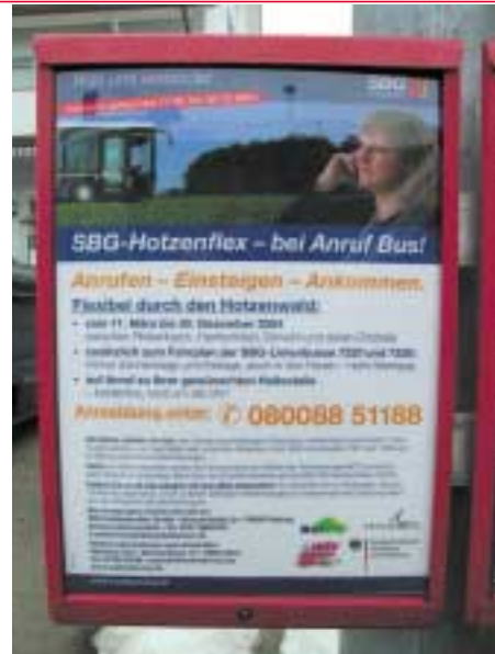
Informationen zum Hotzenflex an der Haltestelle

der im Rahmen von Nahvis (Neue Nahverkehrsangebote im Naturpark Südschwarzwald) zu je 50% von der SBG und dem Bundesministerium für Bildung und Forschung finanziert wurde, musste dennoch zum Ende des Jahres 2004 eingestellt werden, da für seine Weiterführung keine zusätzlichen Finanzierungspartner gewonnen werden konnten. ■