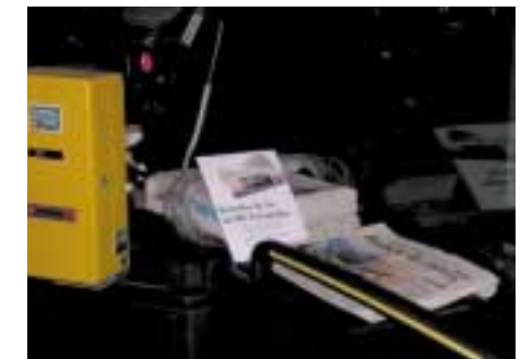
Schön für Pendler: die Auslage der Zeitung früh morgens im SBG-Bus

später zu lesen. Die Auswertung der bei den Pendlern durchgeführten Umfrage ergab, dass viele Fahrgäste das Angebot nutzten. Die befragten Fahrgäste beurteilten die Aktion durchweg mit „gut“ und „sehr gut“. Auf Grund der positiven Resonanz sind bereits weitere befristete ZeitungsBusse bei der SBG geplant.