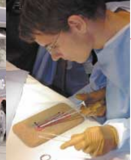
Ganz schön „forsch“...