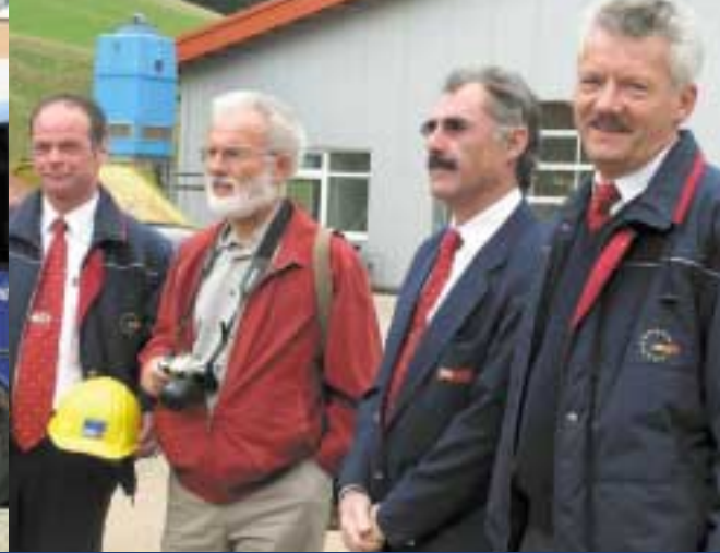
Vorfreude: Furtwanger Busfahrer beim Spatenstich in Furtwangen