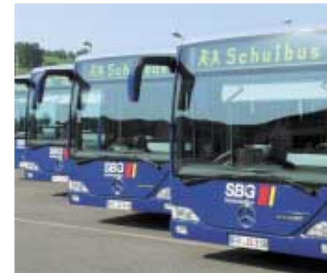
Die SBG muss bei der Schülerbeförderung starke Einbußen hinnehmen

Zu den genannten Kürzungen plant die Regierung, die Ausgleichszahlungen für die kostenlose Beförderung von Schwerbehinderten zu reduzieren. Falls das Gesetz verabschiedet wird, wirkt sich auch dies negativ auf die Einnahmen der Verkehrsunternehmen aus.