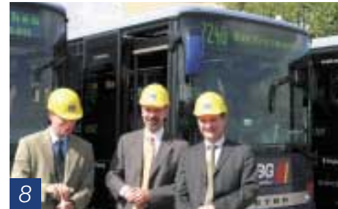
Spatenstich für neue SBG-Immobilien

NEOMAN Bus – Ein Unternehmen der MAN Gruppe