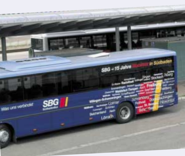
Bereit zur Abfahrt: Der SBG-Bus im „Jubiläumskleid“