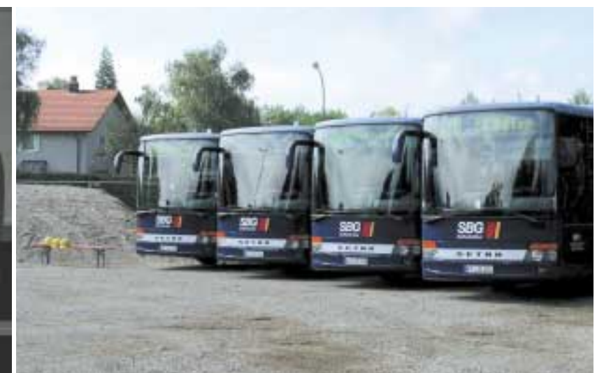
Unsere neuen Setra-Busse warten schon gespannt...