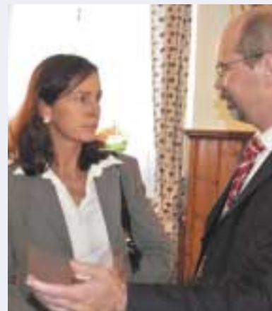
Gespräche in Bonndorf

Aktuelle Entwicklungen bei Zahlungen der öffentlichen Hand stellen die SBG vor neue Herausforderungen, die es zu meistern gilt (siehe Artikel nächste Seite). ■